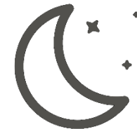
Moon Walk (gåture i måneskin)