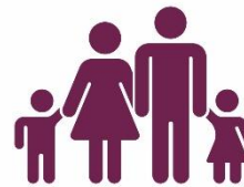
Gåture for børn/familier