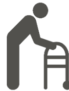
Korte gåture for dem, der ikke går så godt