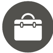
Frokost-gåture på arbejdspladsen