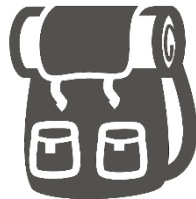
Lange gåture for dem, der kan lide udfordringer