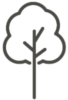
Vandreture i dit lokalområde

WE WALK er for alle, der gerne vil ud og gå. Uanset om det er en vandretur på 40 km eller en kort spadseretur på én km, du har lyst til at arrangere, så er du velkommen som en del af WE WALK. Vi er sikre på, at der er andre, der vil blive glade for din indsats.